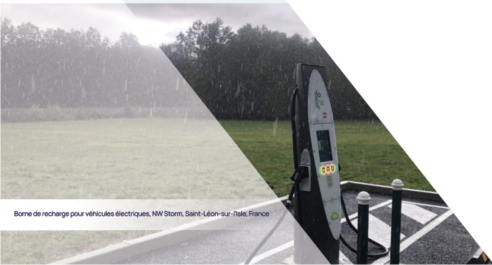
Borne de recharge pour véhicules électriques, NW Storm, Saint-Léon-sur-l'Isle, France