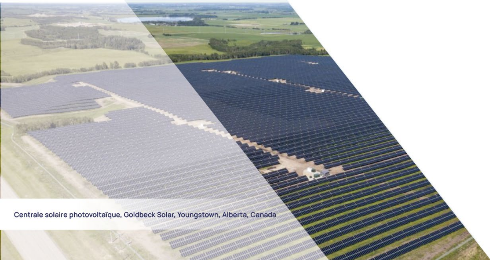
Centrale solaire photovoltaïque, Goldbeck Solar, Youngstown, Alberta, Canada